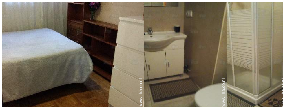
Badkamer(s) met douche Badkamer(s) met douche