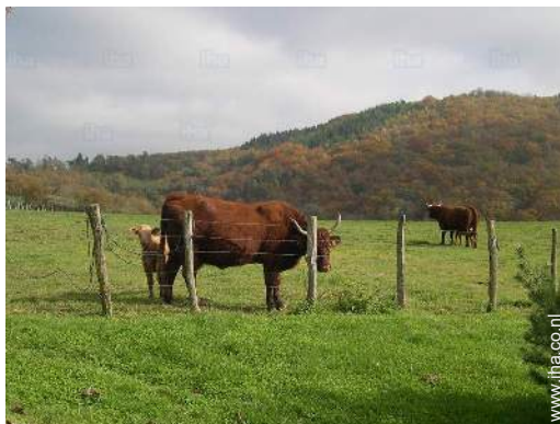
uitzicht op het platteland