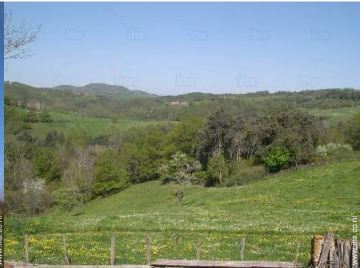
uitzicht vanuit de kamer