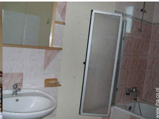
Badkamer(s) met bad