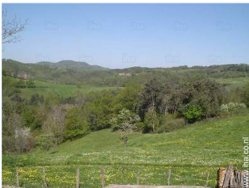
uitzicht vanuit de kamer