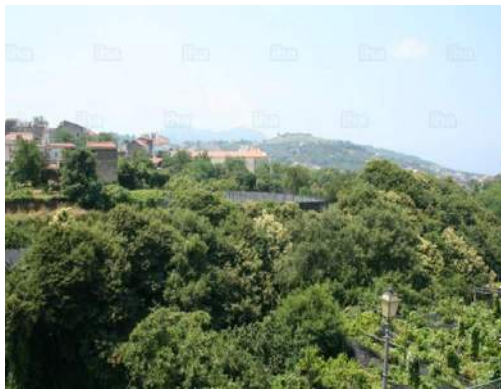
uitzicht vanaf het balkon