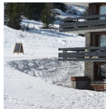
uitzicht vanaf het balkon