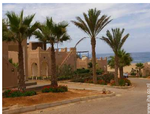
directe toegang tot het strand