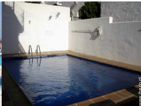
uitzicht vanuit het zwembad