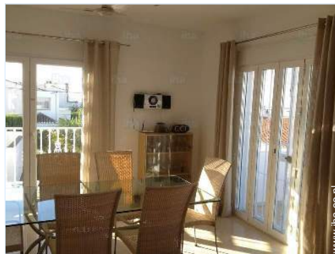
uitzicht vanuit de zitkamer