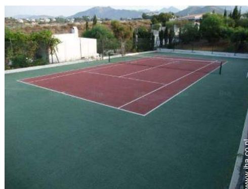
Tennis - synthetische ondergrond