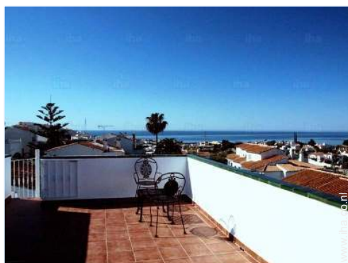
uitzicht op daken