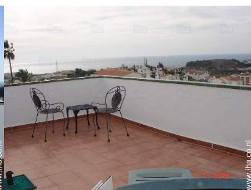
uitzicht vanaf dakterras