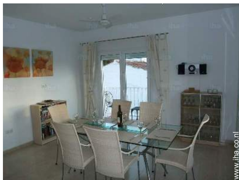
uitzicht vanuit de woonkamer