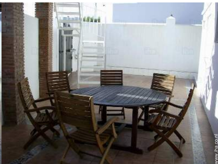
Ter beschikking staande voorzieningen