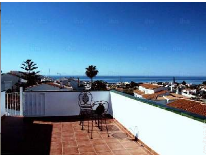
uitzicht op daken