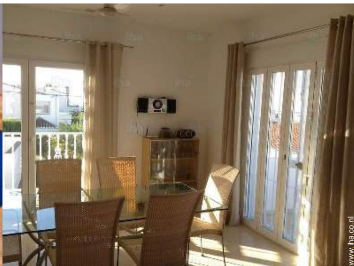
uitzicht vanuit de zitkamer