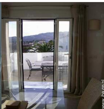
uitzicht vanuit de woonkamer