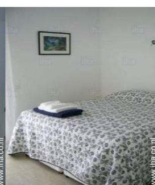
king size bed(den)