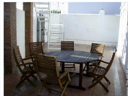
Ter beschikking staande voorzieningen

Stadscentrum 1,5km Bushalte/busstation 300m Supermarkt 800m