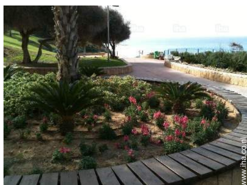
vrijetijds besteding in de nabijheid