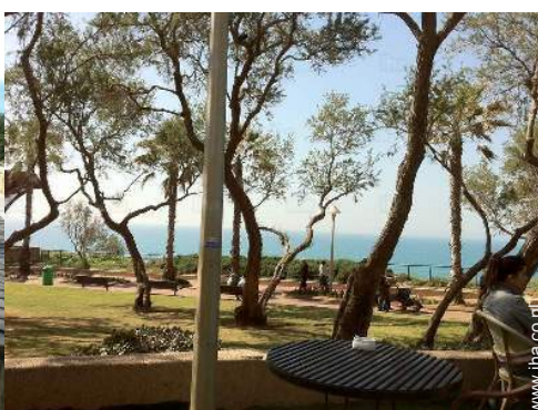
park en tuin