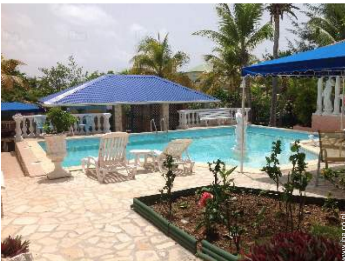
uitzicht op tuin/park