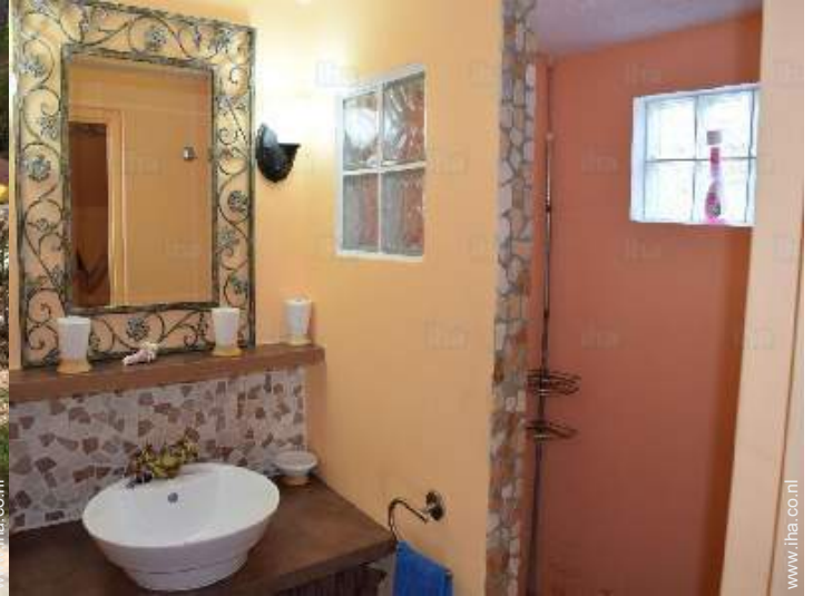
Badkamer(s) met douche