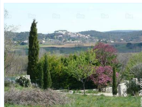
uitzicht vanuit de tuin/park

Dorpscentrum 4km Fiets/mountainbike verhuur 5km Bakker <50m Kleine winkeltjes 4km Supermarkt 4km Cybercafé 3km Postkantoor 3km Geldautomaat 3km Apotheek 4km Dokter 3km Ziekenhuis 3km