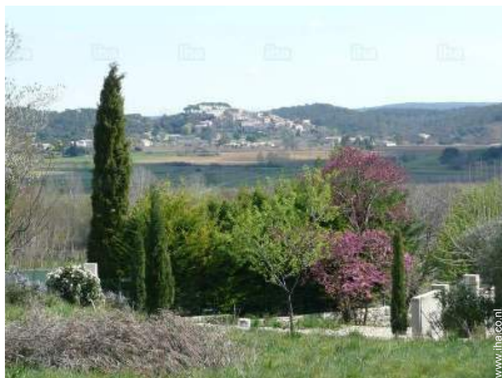
uitzicht vanuit de tuin/park