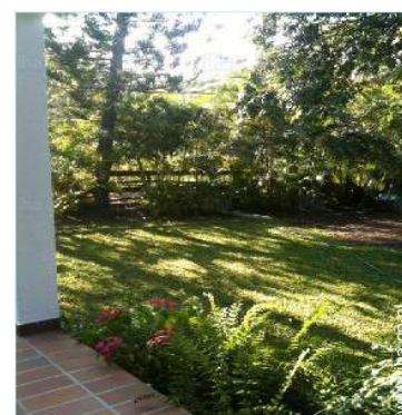
uitzicht op tuin/park