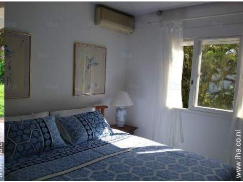
king size bed(den)