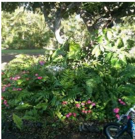
uitzicht op tuin/park