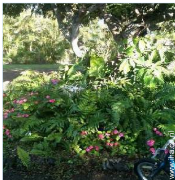
uitzicht op tuin/park