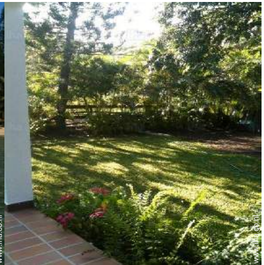
uitzicht op tuin/park