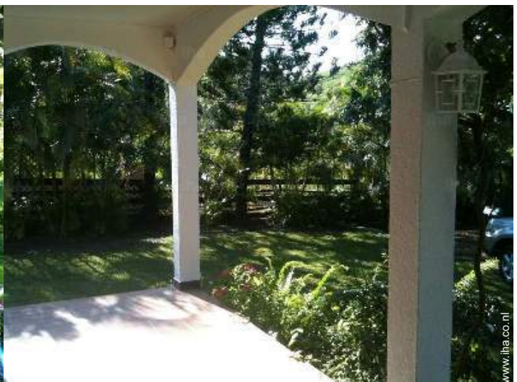
uitzicht vanaf de veranda