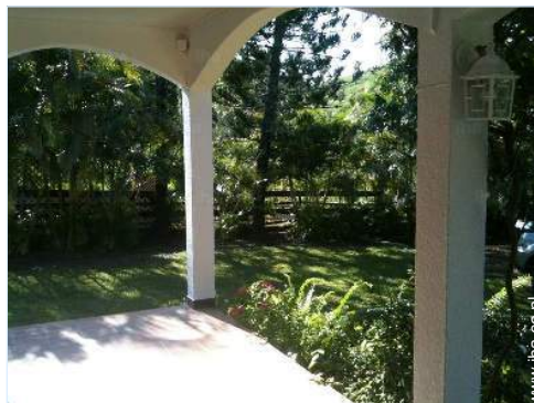
uitzicht vanaf de veranda