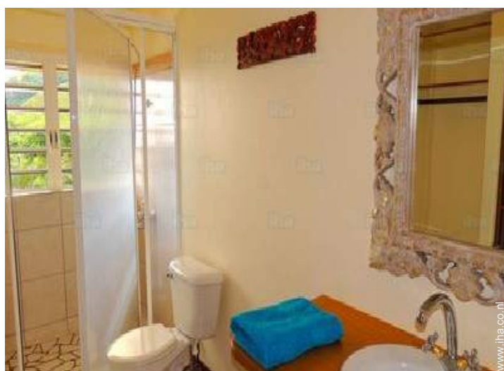
Badkamer(s) met douche