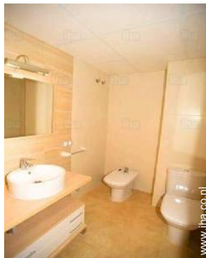
Badkamer(s) met bad