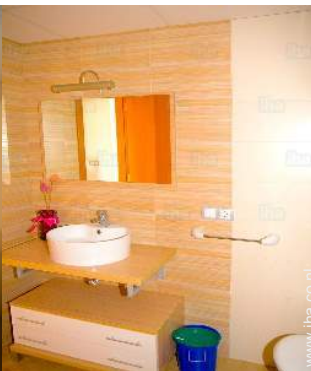
Badkamer(s) met bad