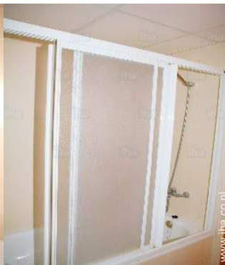
Badkamer(s) met douche