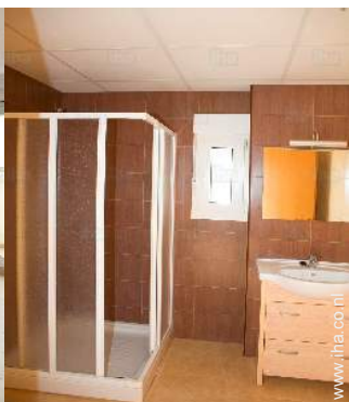
Badkamer(s) met douche