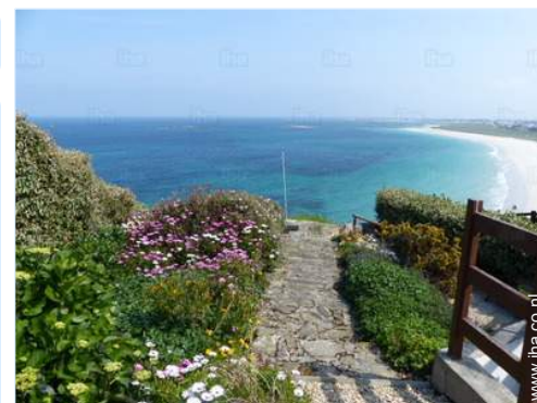
uitzicht vanuit de tuin/park