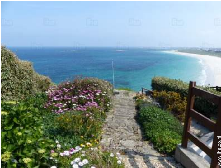
uitzicht vanuit de tuin/park