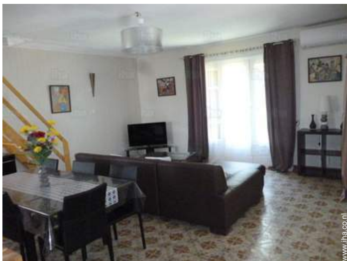
Binnenhuis inrichting en comfort