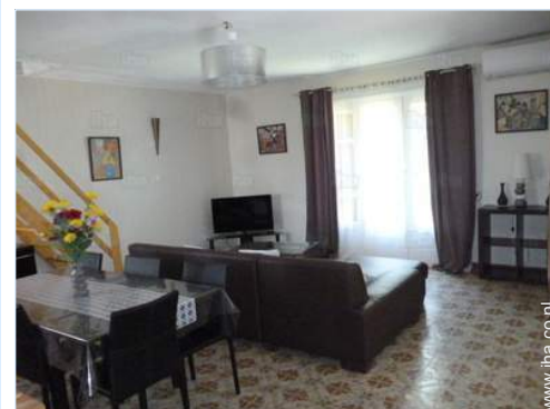
Binnenhuis inrichting en comfort