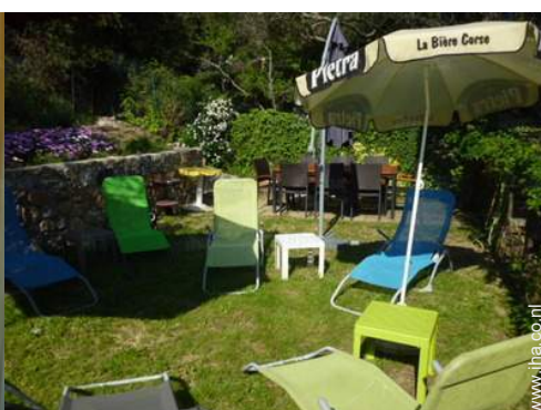
uitzicht vanuit de tuin/park