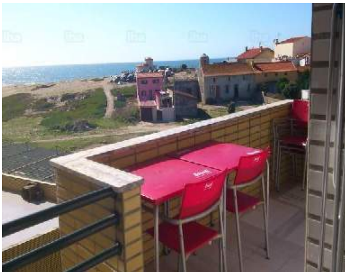
uitzicht vanuit het huis