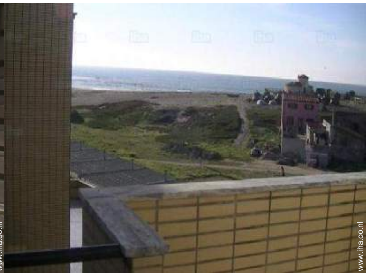
uitzicht vanuit het huis