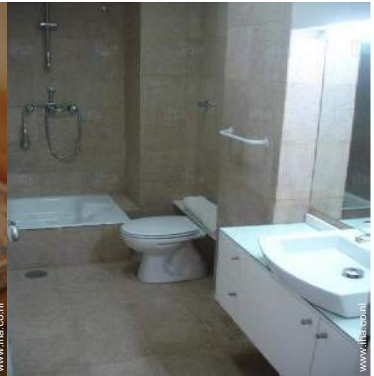
Badkamer(s) met douche