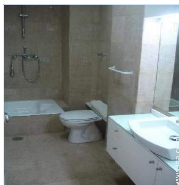
Badkamer(s) met douche