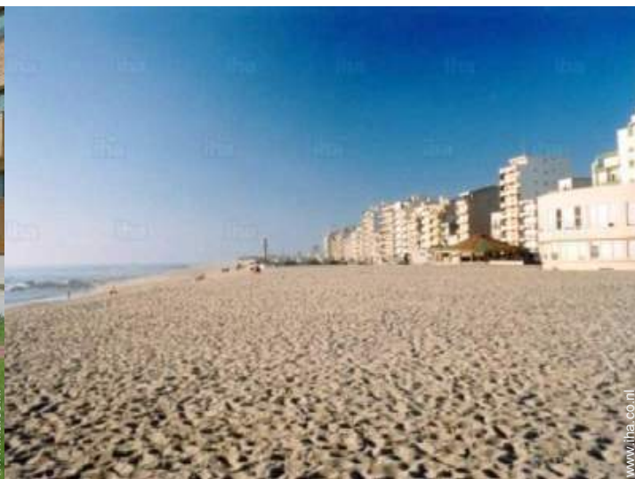
strandrecreatie in de buurt