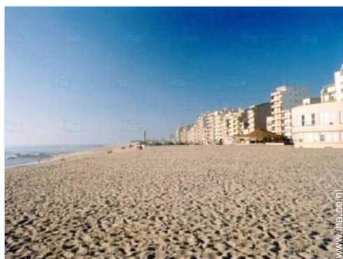
strandrecreatie in de buurt

Overdekte parkeerplaats : 1 individueel gesloten. Niet overdekte parkeerplaats