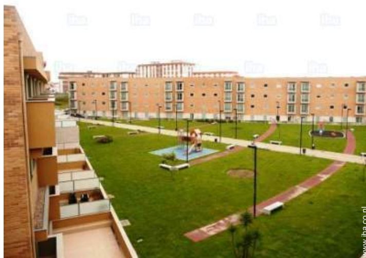
uitzicht op tuin/park