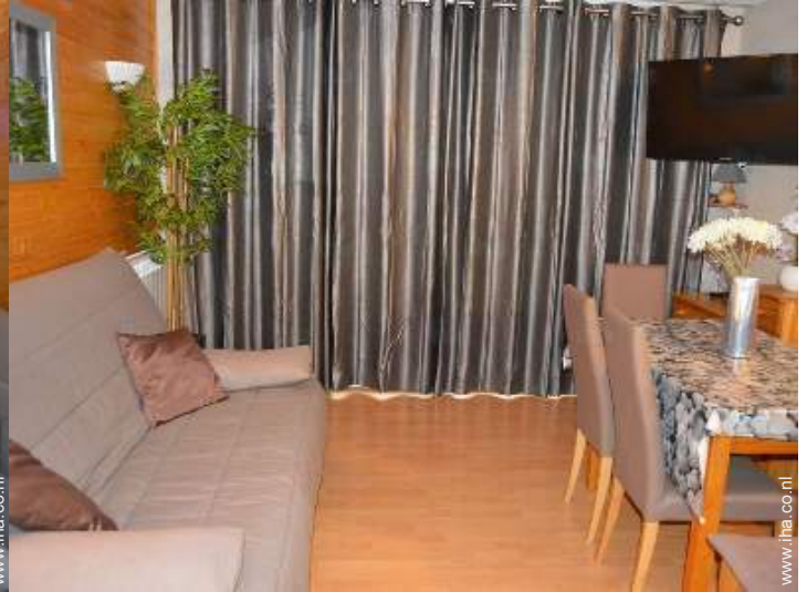
slaapbank(en) 2 pers