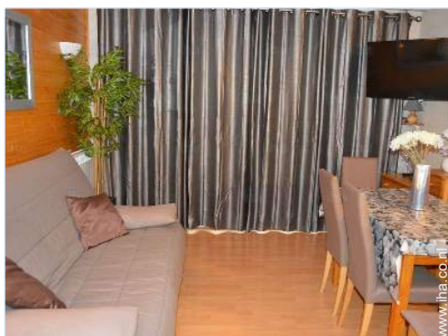
slaapbank(en) 2 pers