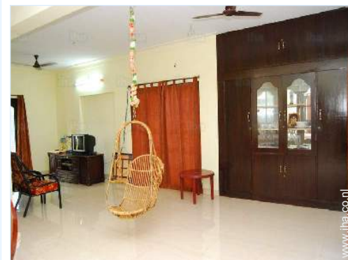
uitzicht vanuit de keuken

Dorpscentrum 2km Stadscentrum 800m Bushalte/busstation 300m Fiets/mountainbike verhuur 500m Verhuur van motoren/scooters 800m Autoverhuur 500m Bootverhuur 1,5km Bakker 500m Traiteur 500m Kleine winkeltjes 200m Supermarkt 500m Luxe- en merkwinkels 1km Kapsalon 200m Cybercafé 500m Postkantoor 1km Bank 1km Geldautomaat 500m Apotheek 200m Dokter 200m Verpleegkundige 500m Ziekenhuis 500m Consultatiebureau