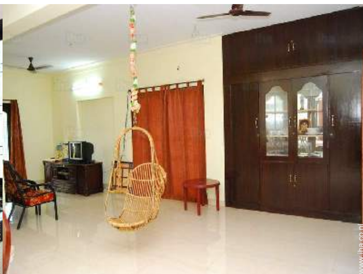
uitzicht vanuit de keuken