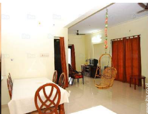
uitzicht vanuit de keuken