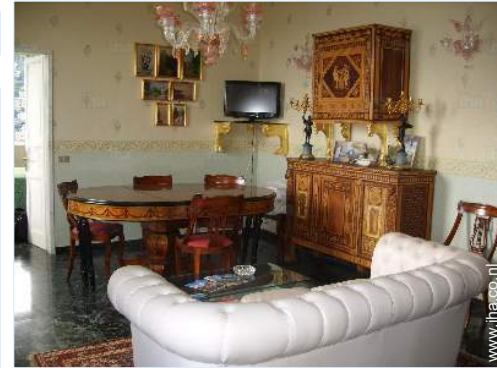
uitzicht vanuit de zitkamer