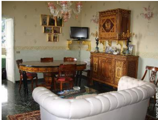
uitzicht vanuit de zitkamer