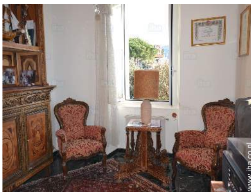
uitzicht vanuit het huis