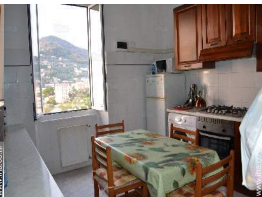
uitzicht vanuit de keuken