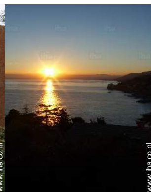
uitzicht op zonsopgang