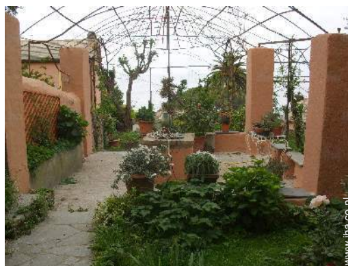
uitzicht vanuit de tuin/park