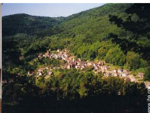
uitzicht op het dorp