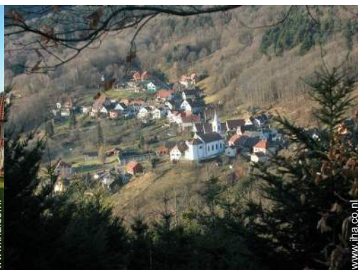
uitzicht op dorpscentrum