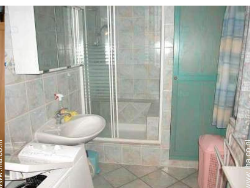
Badkamer(s) met douche