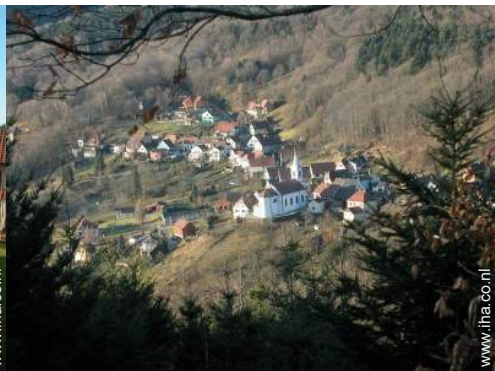
uitzicht op dorpscentrum