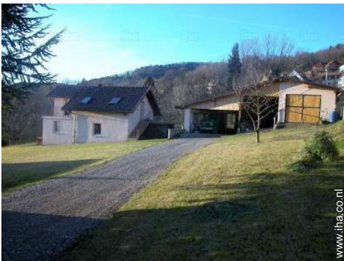
Ter beschikking staande voorzieningen