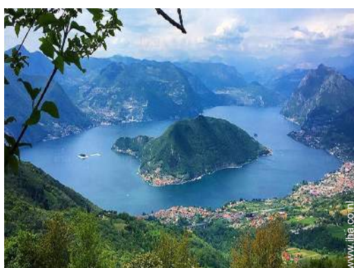
uitzicht op het meer