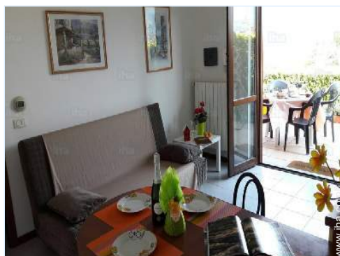
uitzicht vanuit de woonkamer