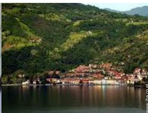
uitzicht op het meer