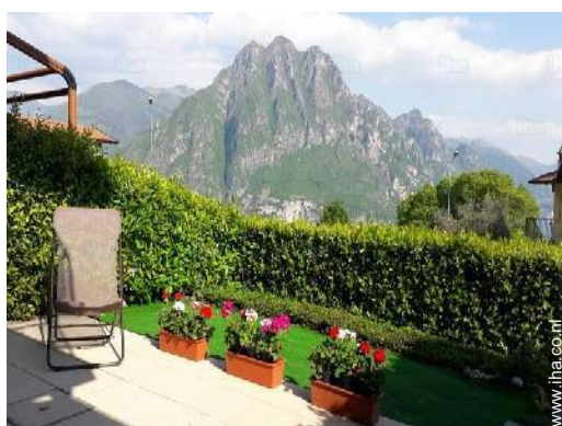
overzicht van het bezit