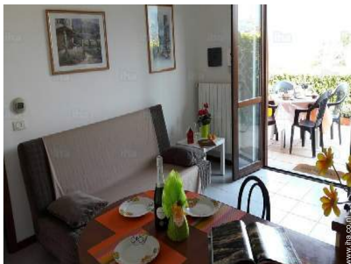
uitzicht vanuit de woonkamer