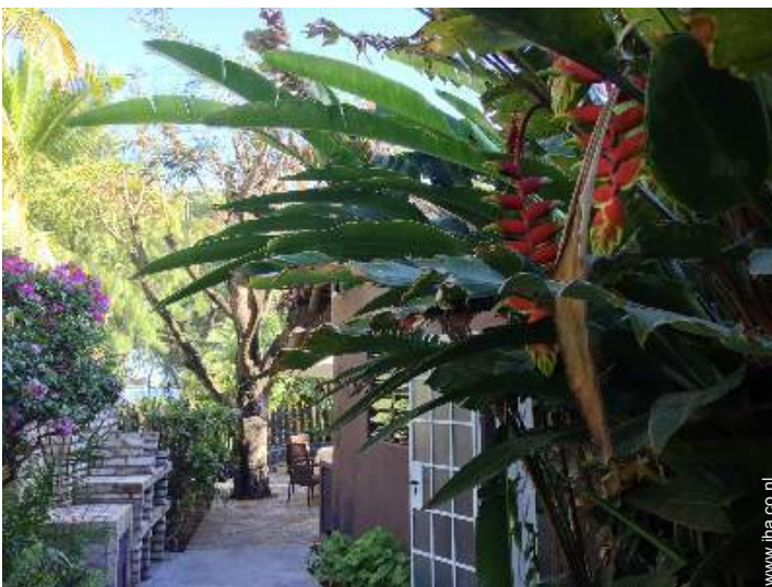
Ter beschikking staande voorzieningen