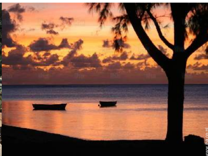
uitzicht op zonsopgang