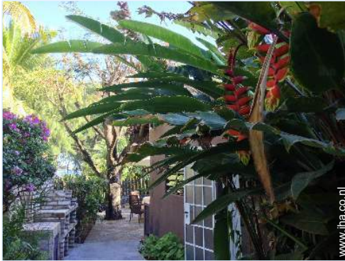
Ter beschikking staande voorzieningen