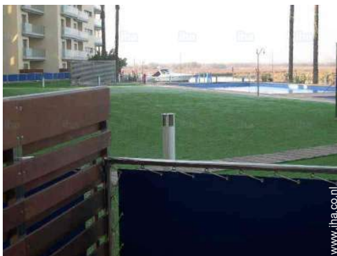
uitzicht vanuit de eetkamer