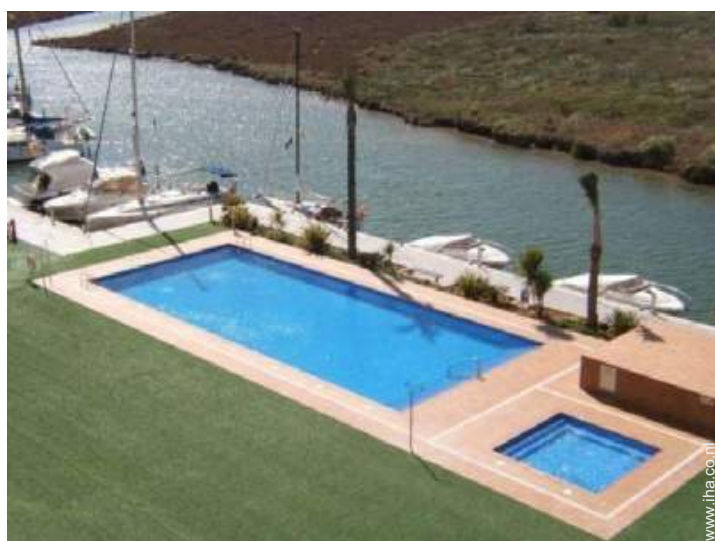
Voor de gasten beschikbare faciliteiten buitenshuis