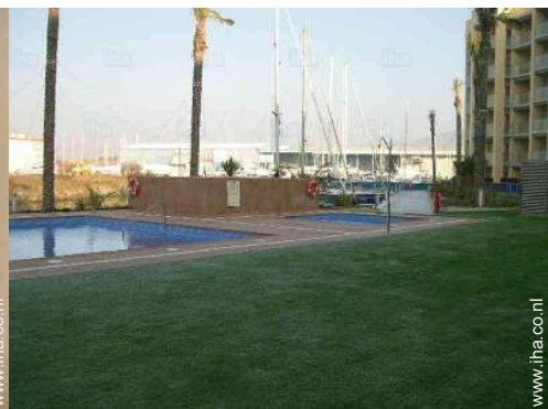
uitzicht op haven