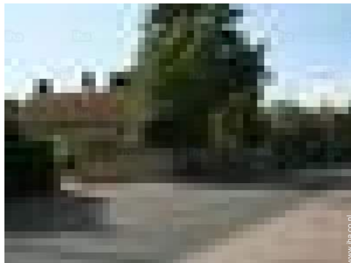
uitzicht op straat/laan