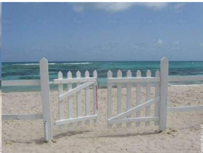
directe toegang tot het strand