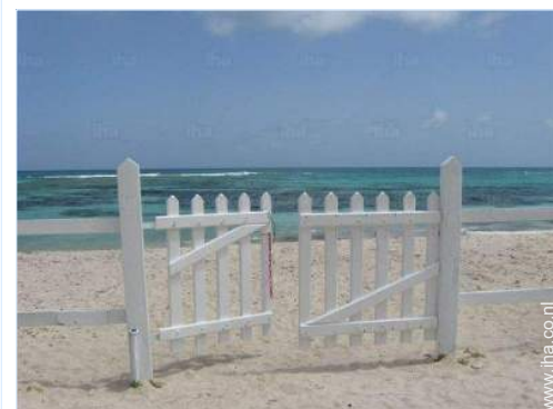
directe toegang tot het strand