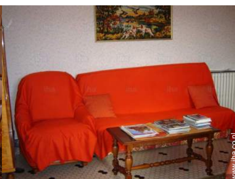
mogelijkheid voor extra slaapplekken