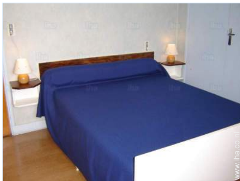
Slaapplaatsen - bed(den)