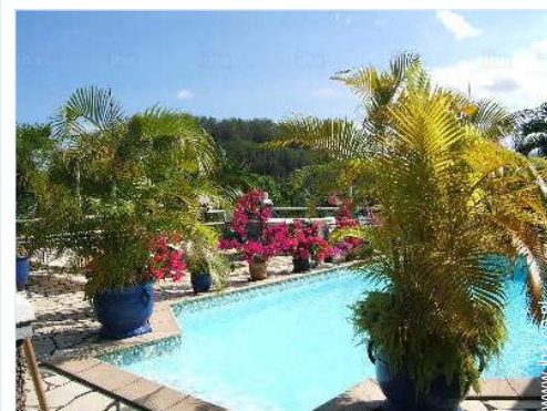
zwembad in de residentie