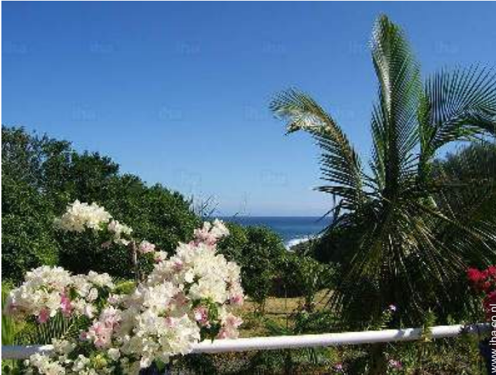
uitzicht vanuit het zwembad