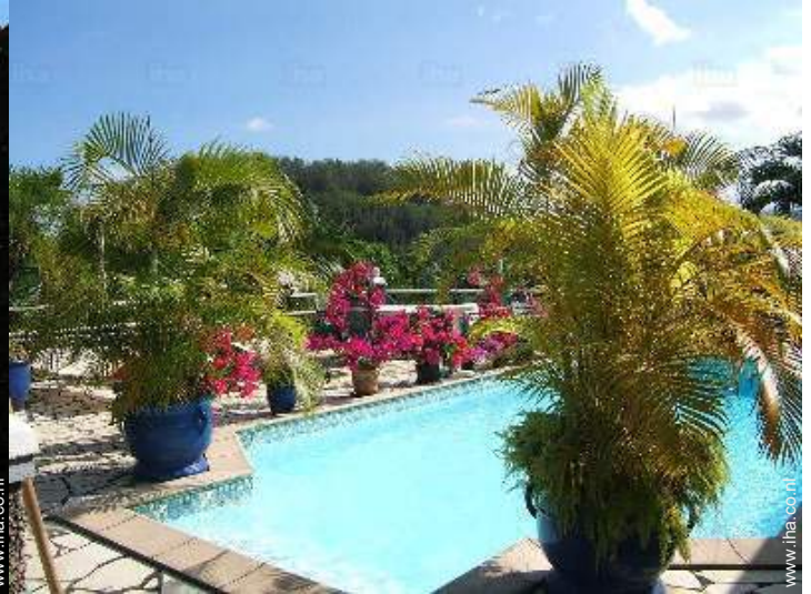
zwembad in de residentie