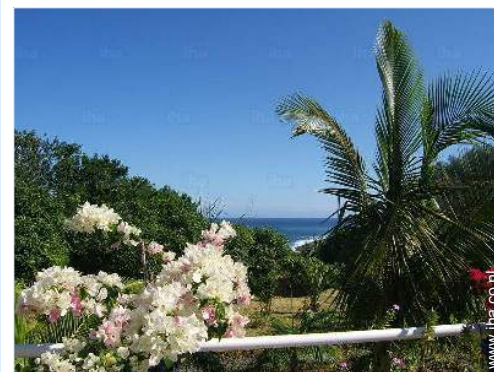
uitzicht vanuit het zwembad

Stadscentrum 800m Bushalte/busstation 800m Autoverhuur 300m Bakker 800m Kleine winkeltjes 500m Supermarkt 800m Luxe- en merk winkels 1km Kapsalon 500m Cybercafé 15km Postkantoor 1km Bank 800m Geldautomaat 1km Apotheek 500m Dokter 800m Ziekenhuis 800m