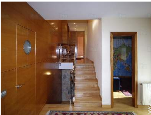
uitzicht vanuit de eetkamer