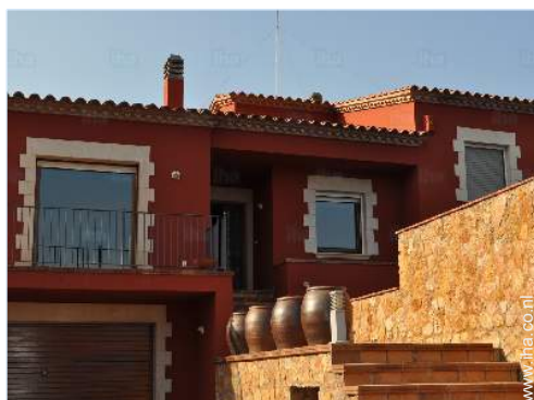
overzicht van het bezit