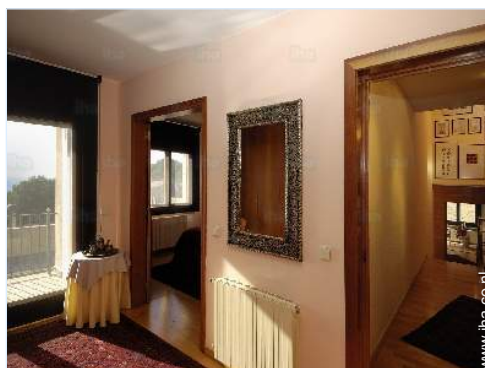
uitzicht vanuit de kamer

Vaatwerk/bestek, huishoudelijke artikelen en keukengerei, koffiekkan, broodrooster, Sinaasappelpers, kookplaten, oven, magnetron, afzuigkap, koelkast, vriezer, vaatwasser, wasmachine, wasdroger, stofzuiger, strijkijzer, strijkplank