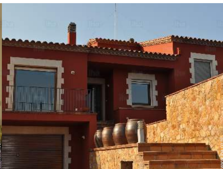
overzicht van het bezit