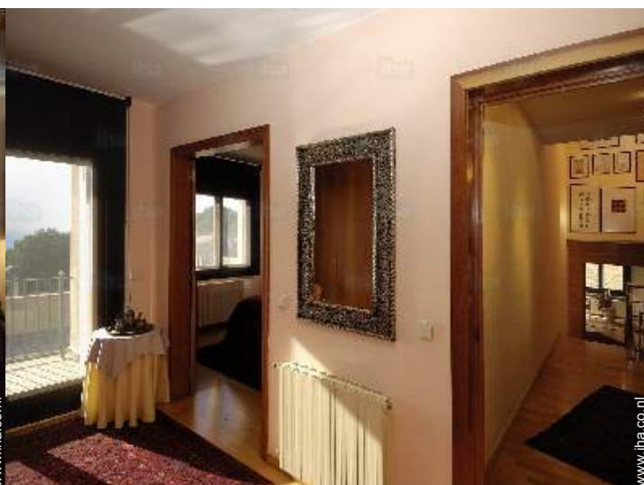
uitzicht vanuit de kamer