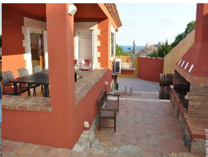
uitzicht vanaf de patio