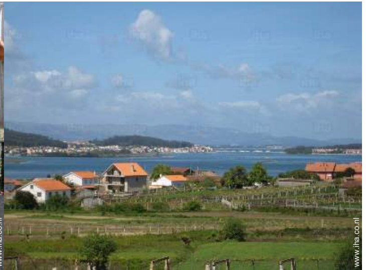
uitzicht vanaf het balkon