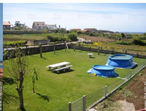
uitzicht vanaf het balkon