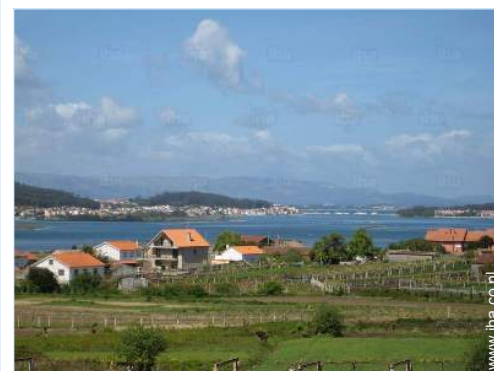
uitzicht vanaf het balkon