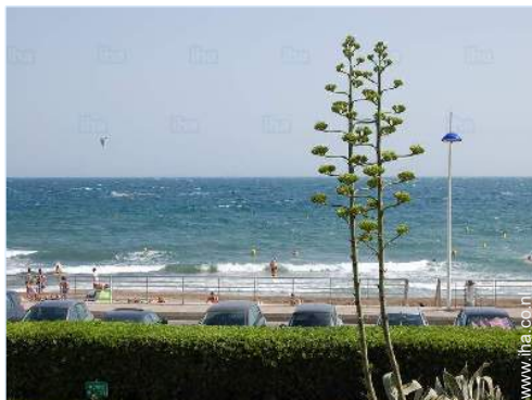
uitzicht vanaf het terras

Niet overdekte parkeerplaats : in de residentie.