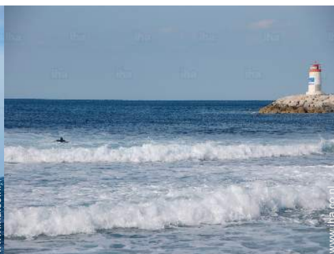
uitzicht op zee