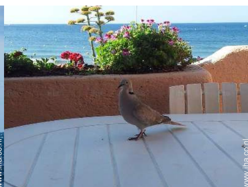
uitzicht vanuit de woonkamer