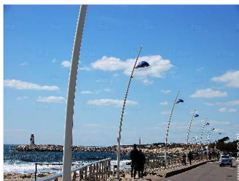
uitzicht vanuit de tuin/park

Kinderen welkom Huisdieren onder voorwaarden toegestaan na te vragen bij de eigenaar Dekking mobiele telefoon Water : warm/koud Elektrische spanning : 220-240V / 50Hz