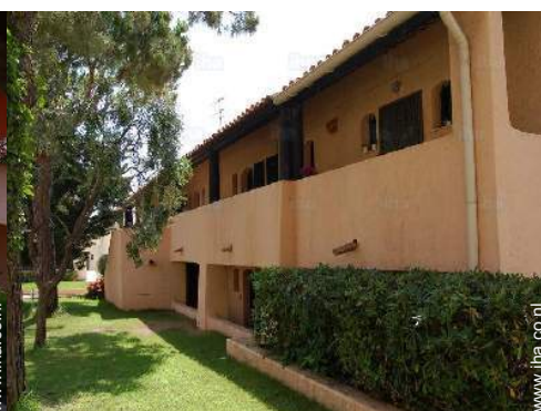
overzicht van het bezit