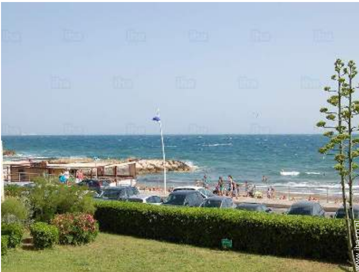
uitzicht vanaf het terras