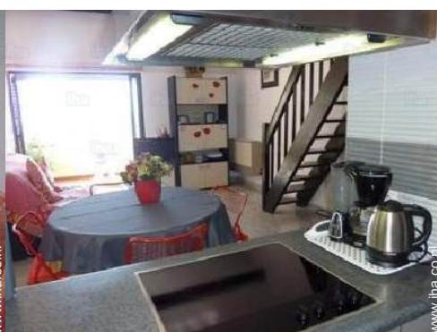
uitzicht vanuit de keuken