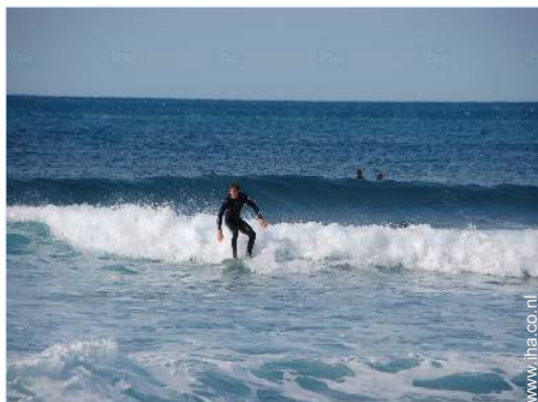
watersportactiviteiten in de omgeving