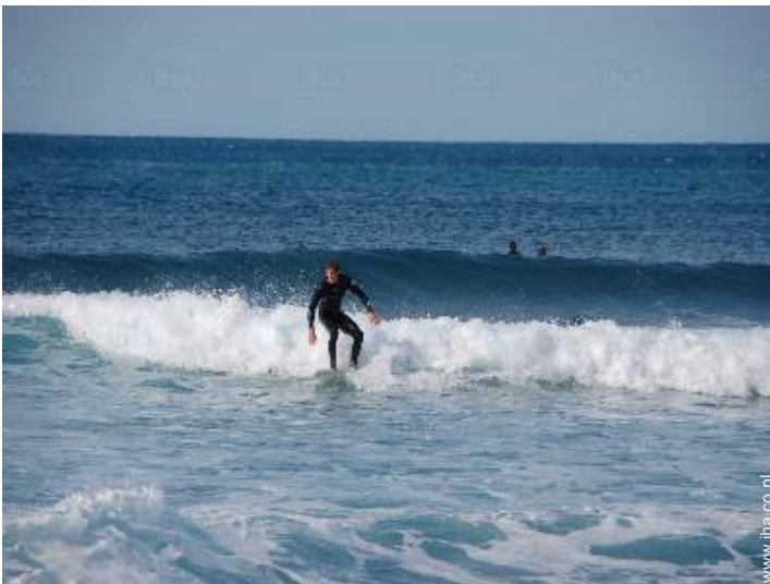
watersportactiviteiten in de omgeving