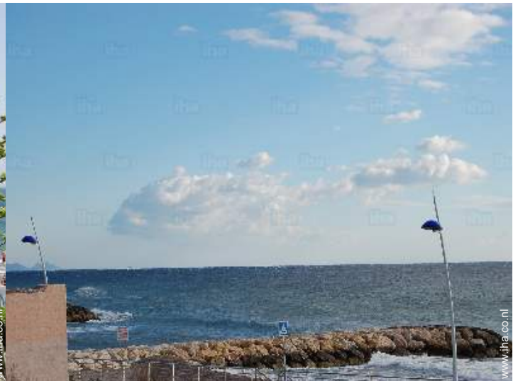
uitzicht vanaf het terras