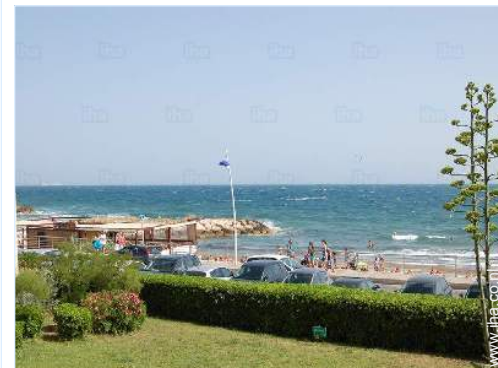
uitzicht vanaf het terras