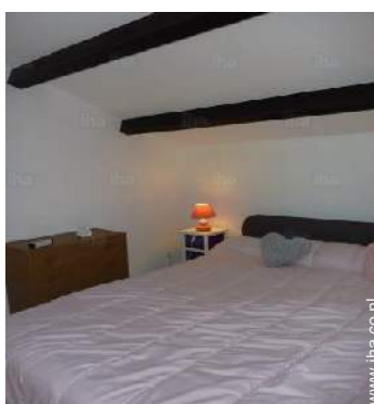
Slaapplaatsen - bed(den)