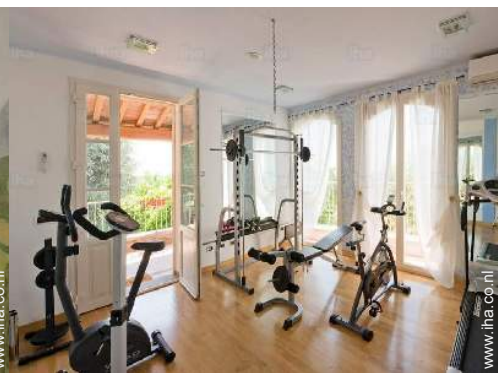
Ter beschikking staande voorzieningen