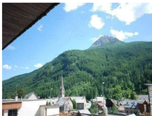
uitzicht op de bergen