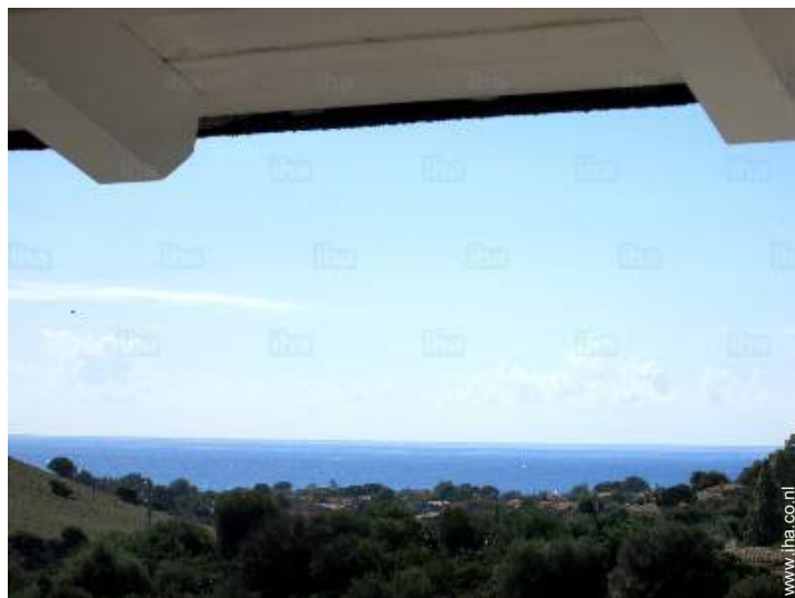
uitzicht vanuit de tuin/park