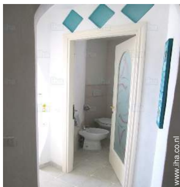
uitzicht vanuit de kamer