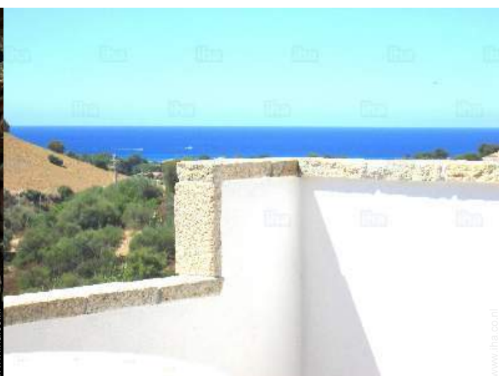
uitzicht op zee