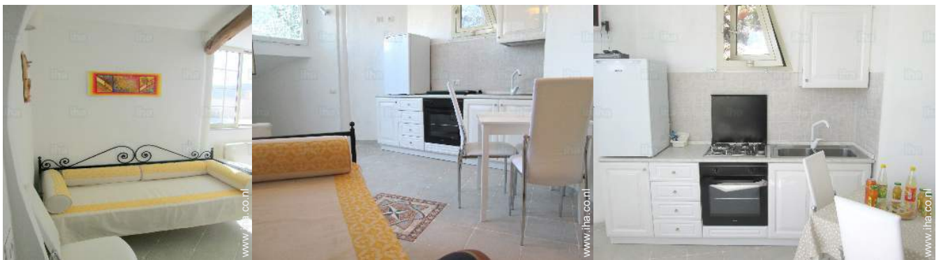
uitzicht vanuit de zitkamer