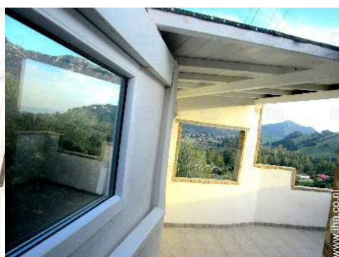
uitzicht vanuit de woonkamer