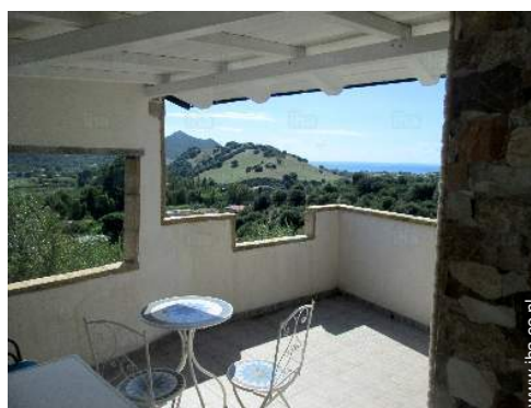
overzicht van het bezit