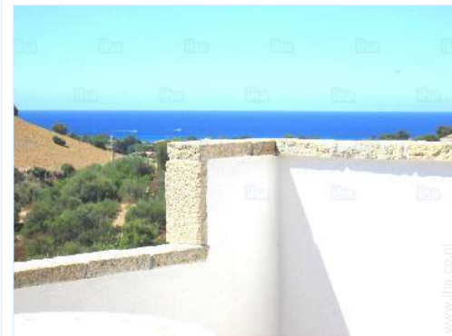
uitzicht op zee

Bootverhuur 800m Verhuur van duikmateriaal 800m Supermarkt 300m Cybercafé 5km Bank 10km Apotheek 500m Dokter 200m Consultatiebureau 200m