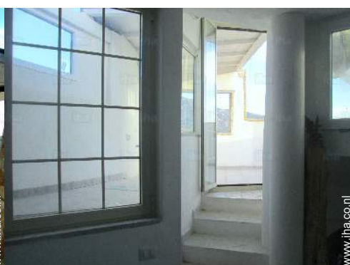
uitzicht vanuit het appartement