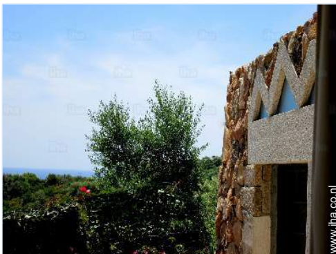
uitzicht vanuit de tuin/park

Niet overdekte parkeerplaats : 1 gereserveerde plaatsen.