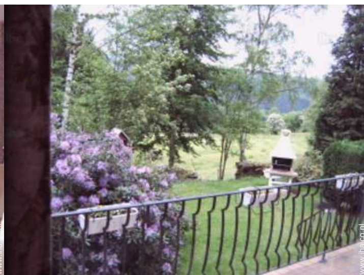
uitzicht vanaf het balkon