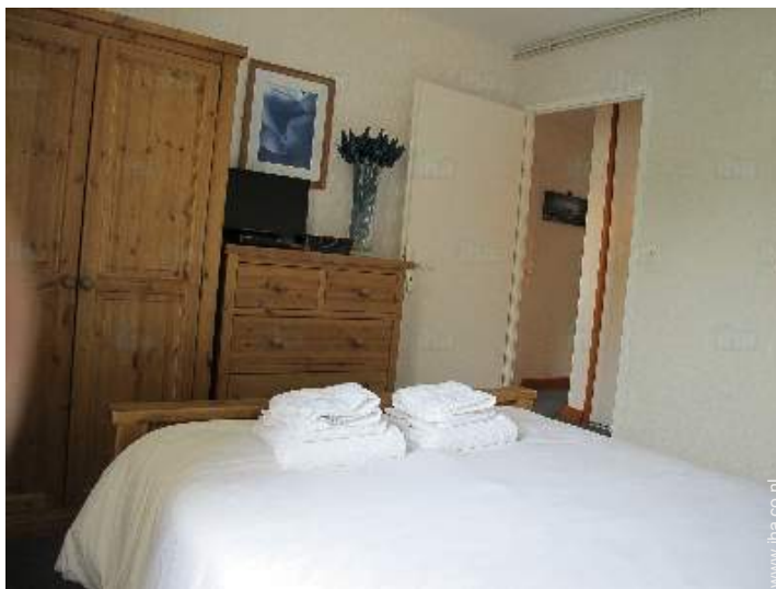
king size bed(den)