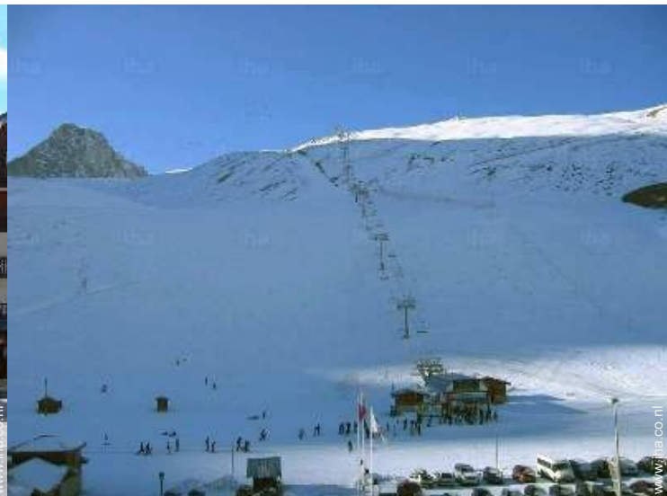
uitzicht vanuit het appartement