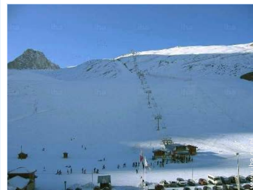
uitzicht vanuit het appartement

Dorpscentrum 100m Bushalte/busstation <50m Busverbinding met de skipistes <50m Fiets/mountainbike verhuur 100m Skiverhuur <50m Bakker <50m Kleine winkeltjes <50m Supermarkt <50m Cybercafé 200m Postkantoor 800m Geldautomaat <50m Apotheek 300m Dokter 800m Ziekenhuis 25km