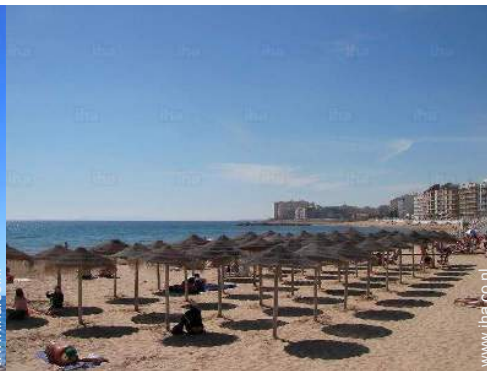
strandrecreatie in de buurt