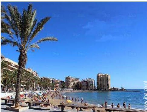
directe toegang tot het strand