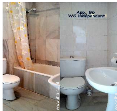
Badkamer(s) met bad Badkamer(s) met bad