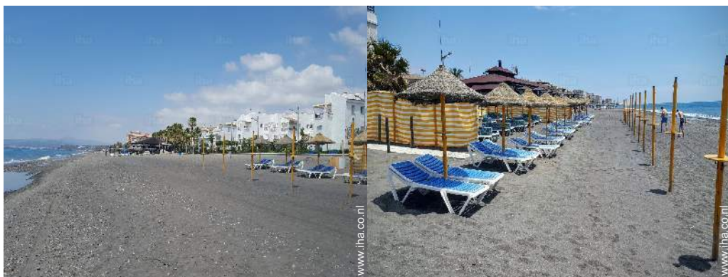
Zicht op zee