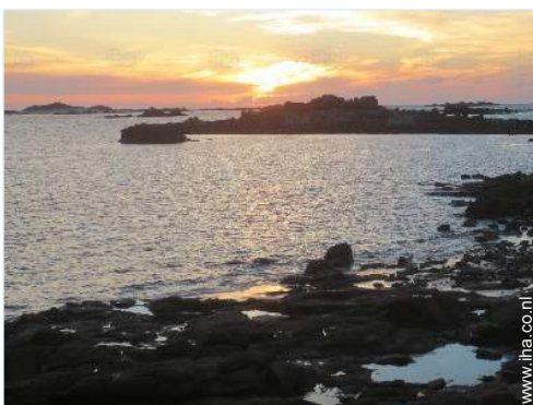
uitzicht op zonsondergang

Voordelen : Directe toegang tot het strand