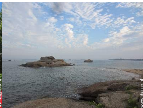
Zicht op zee