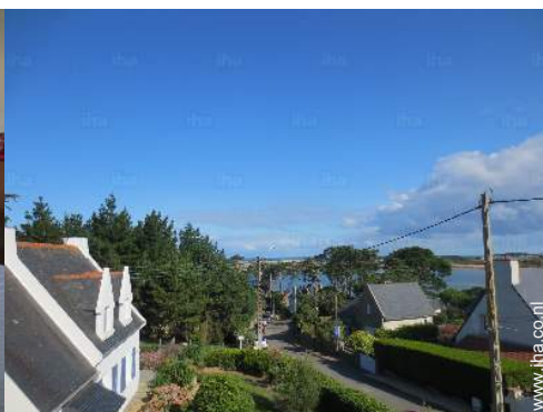
uitzicht vanuit de kamer