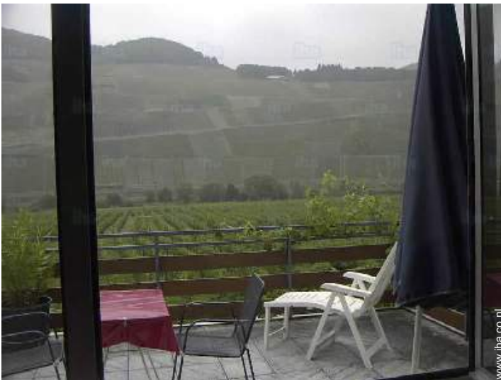
uitzicht vanaf het balkon