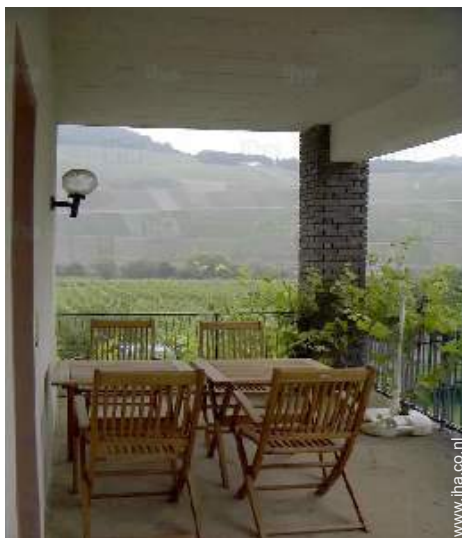
uitzicht vanaf het balkon