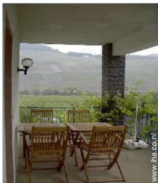
uitzicht vanaf het balkon