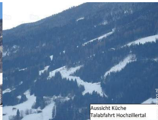
Aussicht Küche Talabfahrt Hochzillertal