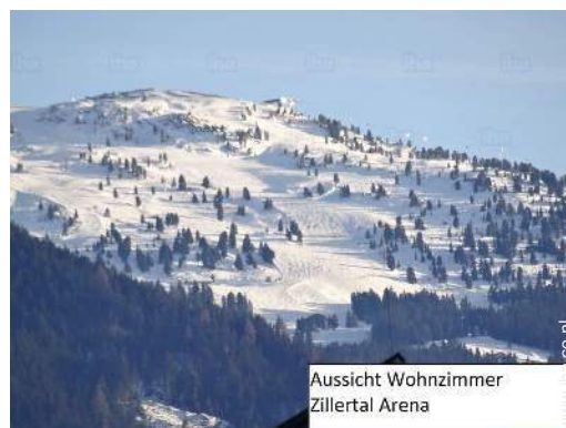
Aussicht Wohnzimmer Zillertal Arena