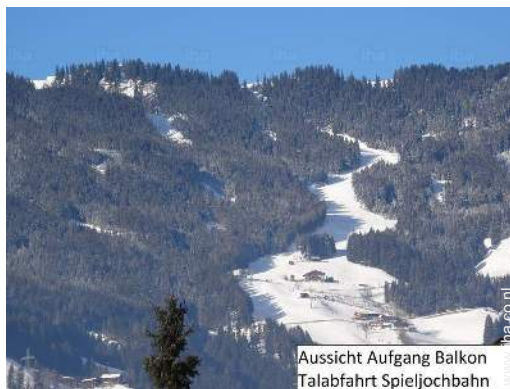
Aussicht Aufgang Balkon Talabfahrt Spieljochbahn