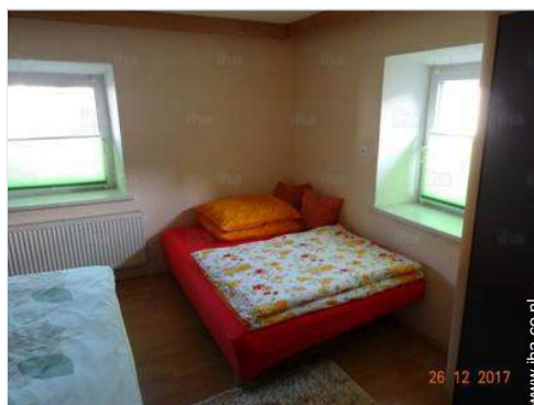
Slaapplaatsen - bed(den)