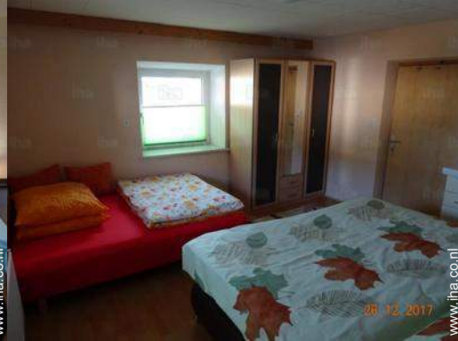
Slaapplaatsen - bed(den)