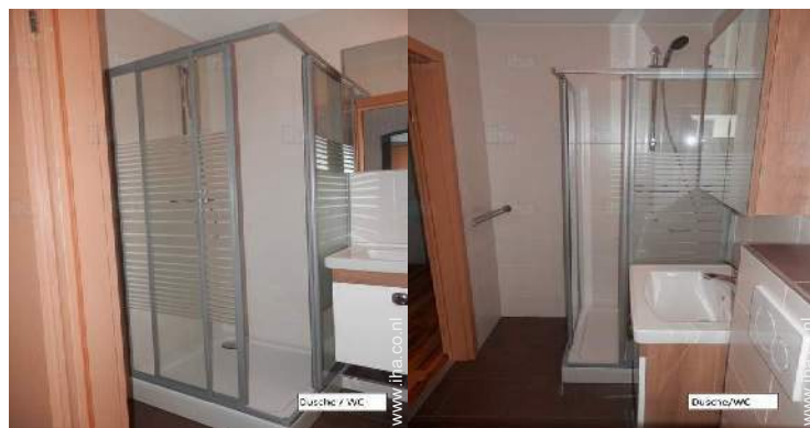
Dusche / WC