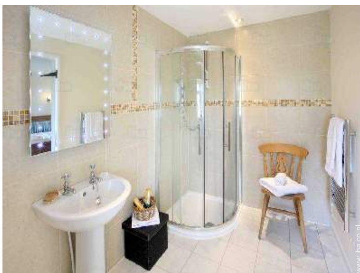
Badkamer(s) met bad