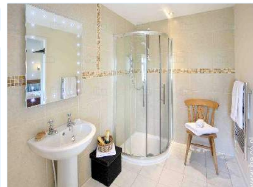
Badkamer(s) met bad

Barbecue, tuintafel(s), 16 tuinstoel(en), serre, schommel, klimrek