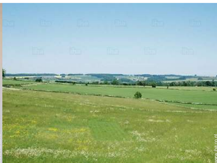
uitzicht vanaf het terras