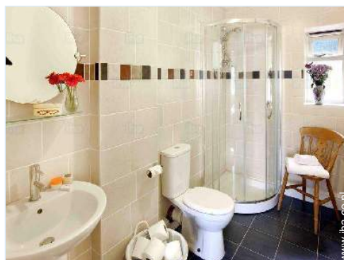
Badkamer(s) met bad