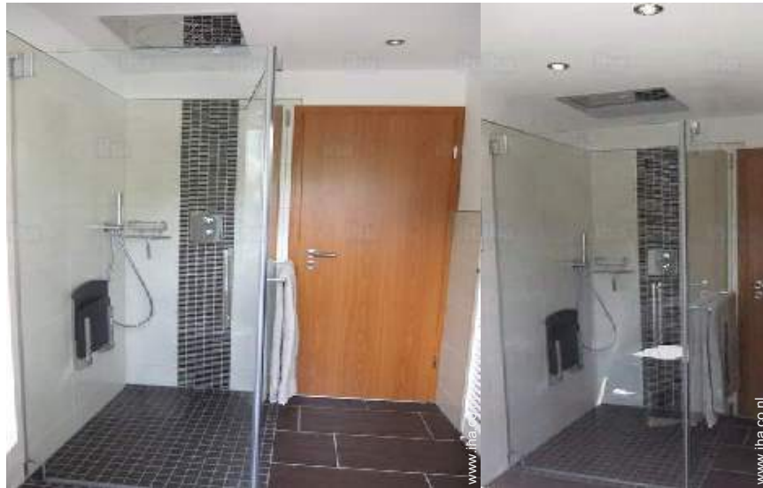
Badkamer(s) met bad