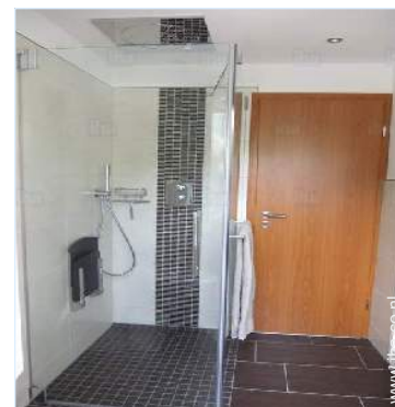
Badkamer(s) met bad

Bushalte/busstation 200m Fiets/mountainbike verhuur 3km Bakker 300m Supermarkt 4km Postkantoor 3km Bank 3km Geldautomaat 3km Apotheek 3km Ziekenhuis 4km