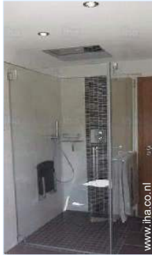
Badkamer(s) met bad