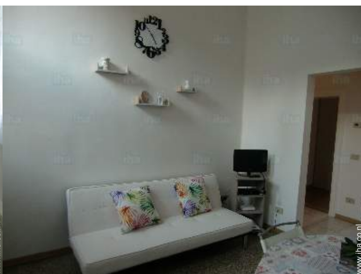
slaapbank(en) 1 pers