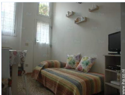
slaapbank(en) 1 pers