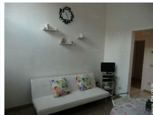
slaapbank(en) 1 pers