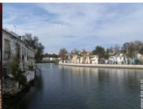
Nabij gelegen steden