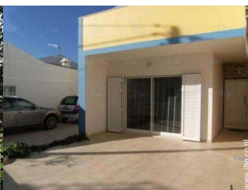
uitzicht vanuit de zitkamer