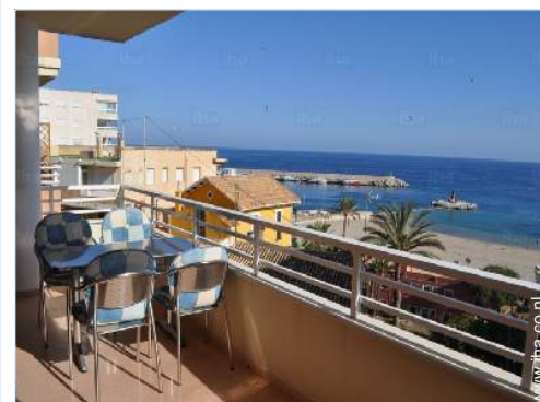
uitzicht vanuit het appartement