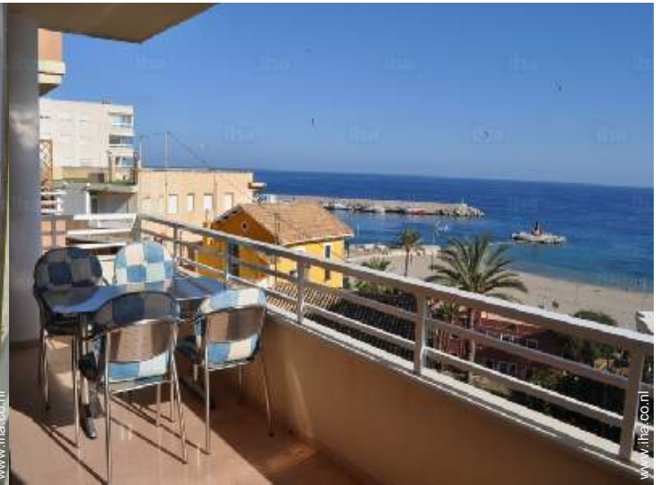
uitzicht vanuit het appartement