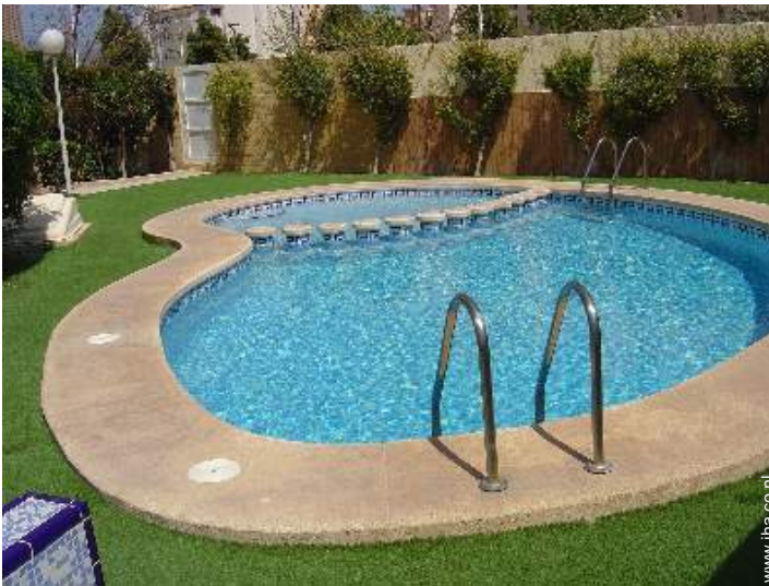
zwembad in de residentie