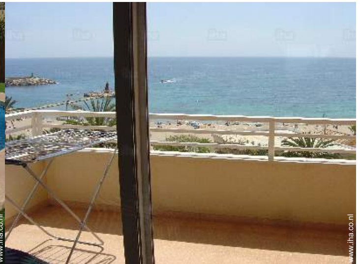
uitzicht vanuit het appartement