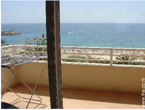
uitzicht vanuit het appartement