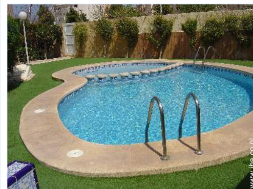
zwembad in de residentie