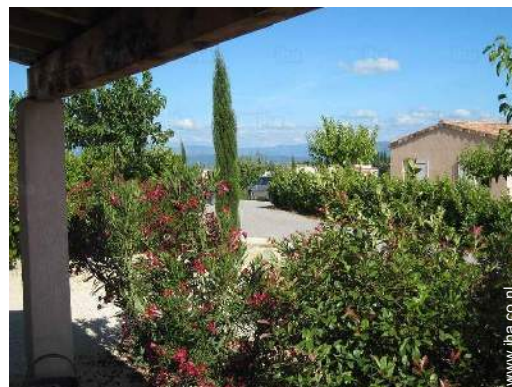
uitzicht vanuit de tuin/park