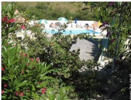
uitzicht op zwembad