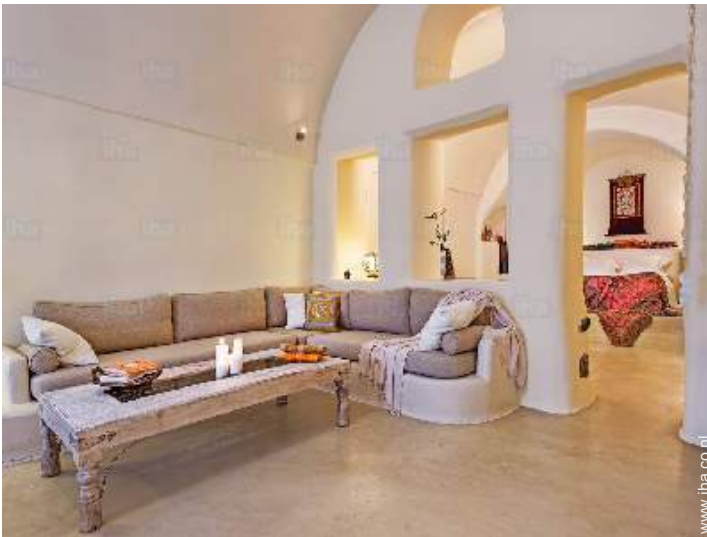
Binnenhuis inrichting en comfort