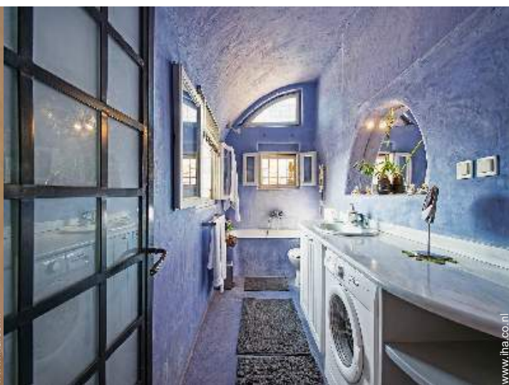
Binnenhuis inrichting en comfort