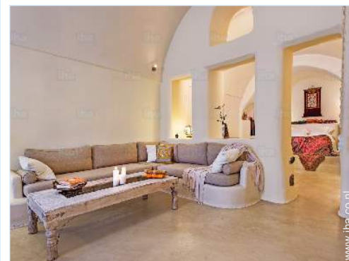
Binnenhuis inrichting en comfort

Dorpscentrum 300m Bushalte/busstation 200m Autoverhuur 200m Supermarkt 300m Geldautomaat 300m