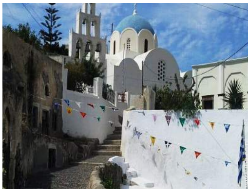
uitzicht op dorpscentrum