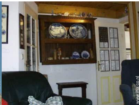
Binnenhuis inrichting en comfort