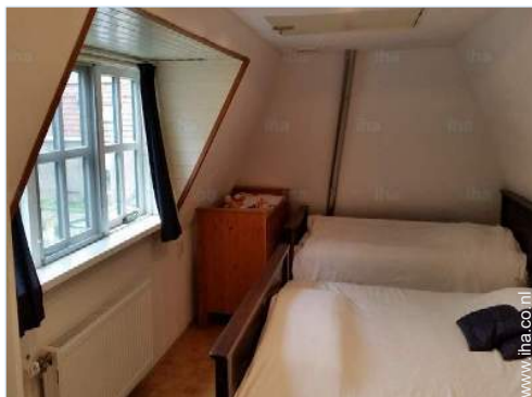
Slaapplaatsen - bed(den)