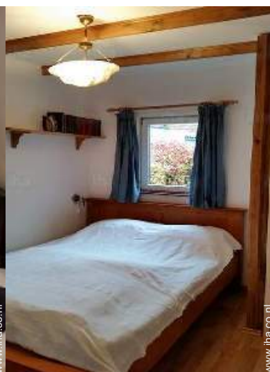
Slaapplaatsen - bed(den)