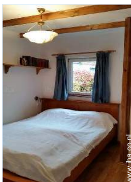
Slaapplaatsen - bed(den)

Kinderen welkom Huisdieren onder voorwaarden toegestaan na te vragen bij de eigenaar Niet-rokers verblijf, dekking mobiele telefoon Water : warm/koud Elektrische spanning : 110-120V / 60Hz Elektrische voeding : electriciteitsnet